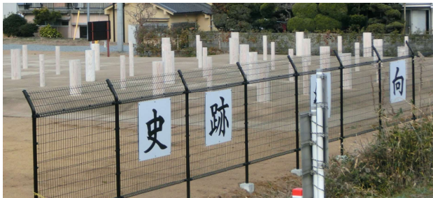
巻向駅近くの「大型建造物」柱跡地